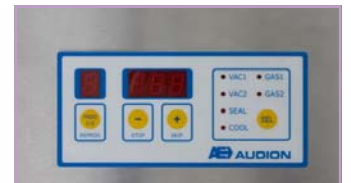
Control digital de la température de soudure sur la Magvac Médical uniquement.