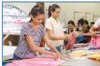
CONDITIONNEMENT À FAÇON E-COMMERCE