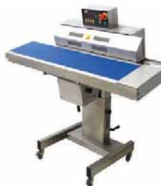
ALL IN SEALER D 552 AHS ET AVTS