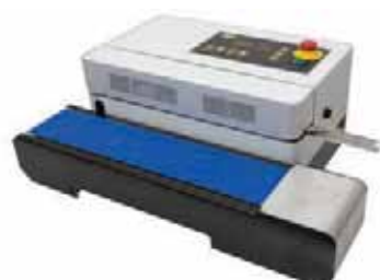
ALL IN SEALER D 545 AH ET AV

La gamme des soudeuses en continu « All In Sealer » comprend des modèles de table et sur pieds pour la fermeture des sacs et des sachets en position horizontale ou verticale.