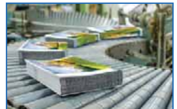
IMPRIMERIE - ART GRAPHIQUE ÉDITION