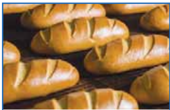
BOULANGERIE VIENNOISERIE - BISCUITERIE