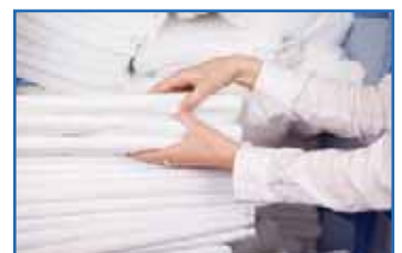
TEXTILE - BLANCHISSERIE