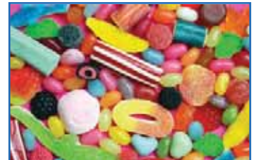
BISCUITERIE - CONFISERIE CHOCOLATERIE