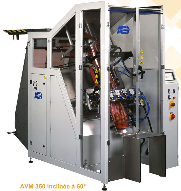
AVM 350 inclinée à 60°