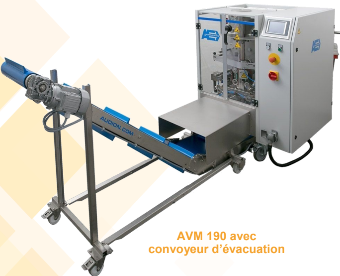
AVM 190 avec convoyeur d'évacuation