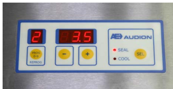
Tableau de commande digital